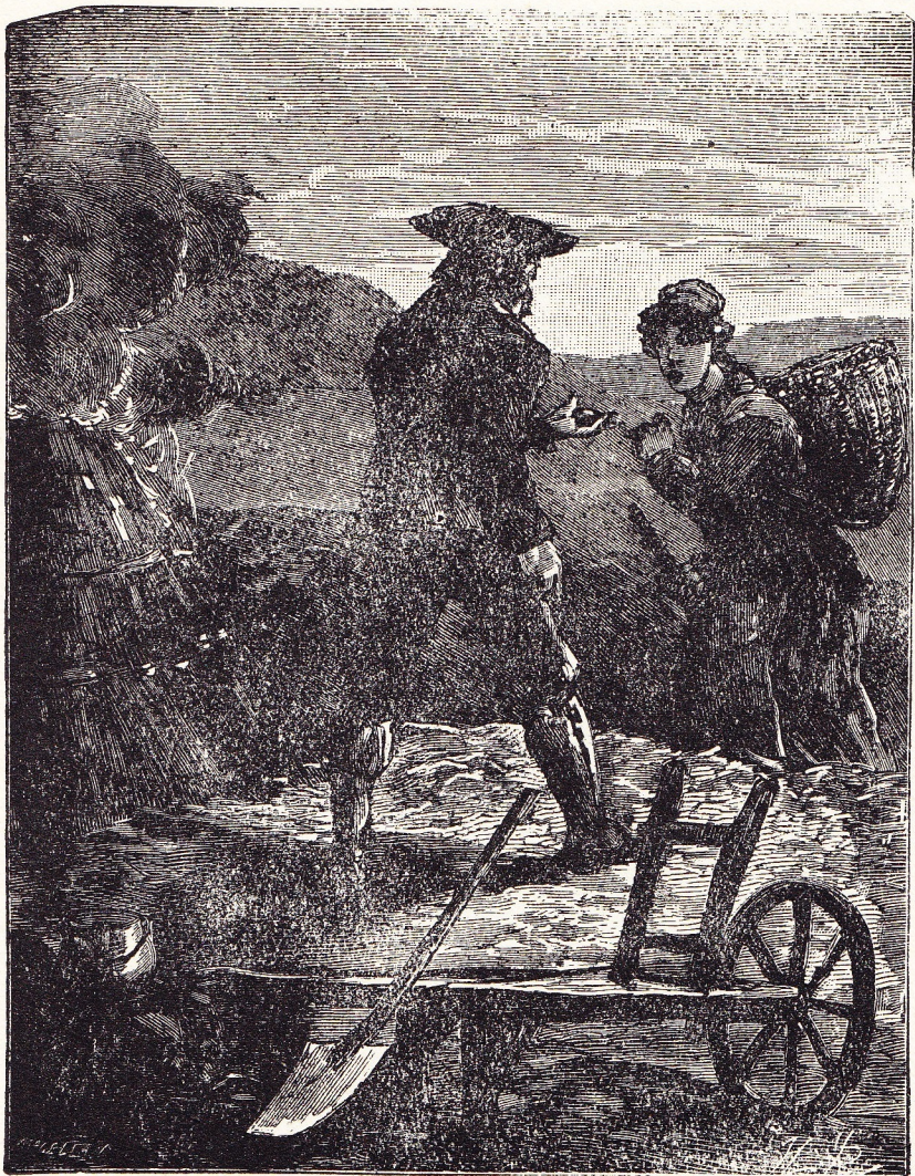
« Ze bedelde langs de straten ». (Blz. 640)